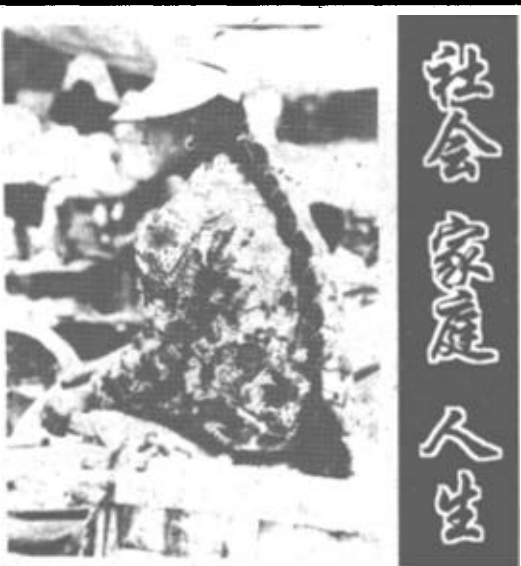
村姑 本版编辑 王玉民